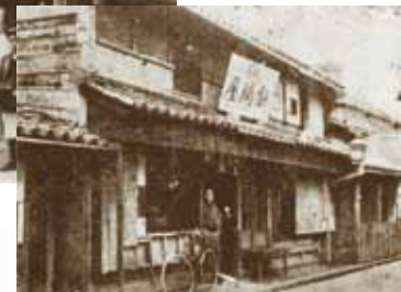
大正4年頃の 浜坂針問屋の風景