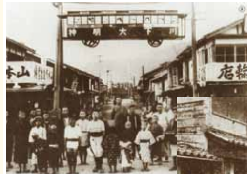
大正3年頃の 浜坂川下祭りの駅前風景

開館時間/午前9時30分～午後5時30分 休館日/毎週水曜日(ただし、その日が祝日にあたるときは、その翌日)